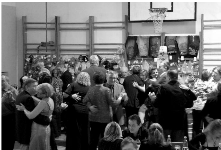
Sál Besedy je stále pořád tělocvičnou a ne důstojným místem pro pořádání plesů.

řící, že začíná zakládat úspěšně tradici – první ples se konal v roce 2009. Od té doby se pravidelně každý rok potkávají rodiny rybářů a jejich přátelé a hodnotí uplynulý rok nad sklenkou vína či kalíškem něčeho ostřejšího. K poslechu první dva roky hrála v té době oblíbená kapela Slimáci. Letos došlo ke změně a k poslechu hráli Namol Band, jejichž repertoár uspokojil snad každé ucho. V době, kdy byla zábava v plném proudu, přišla na řadu tradiční tom-