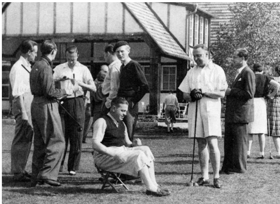
Klánovický golf v poválečné plné slávě