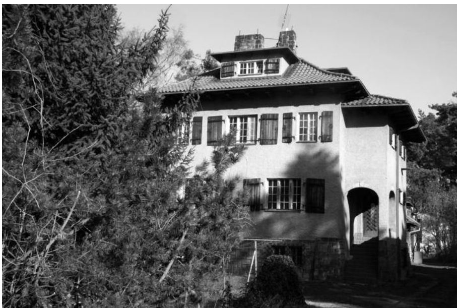
Švestkova vila, poslední významná nemovitost, kterou Klánovice prodaly