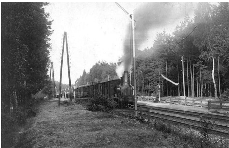
Klánovická železniční zastávka před sto lety