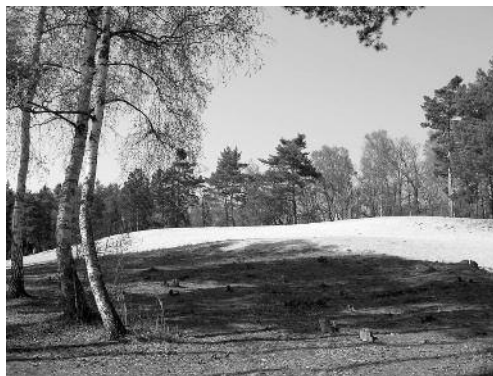
Malá písečná poušť u Labe

Dokážete si představit řeku Labe před 12 000 lety? Její dnešní rovné koryto má s tehdejšími tokem jen málo společného. Před tisíci lety byl tok Labe mnohem delší, řeka meandrovala, nanášela do svých ohybů štěrkopísky a měnila směr. Na holých březích vítr z říčních nánosů vyvál drobný písek, a vytvořil tak pohyblivé přesypy, které se pomalu posouvaly stejně jako na saharské poušti. Nejinak tomu bylo i u obce Písta na Nymbursku. Ještě v dnešní době máte v těchto místech pocit, že se nacházíte ve Středomoří. Vyprahlá písčítá zem a vůně borovic. Přírodním unikátem oblasti je dochovaný zbytek písečné duny. Přesyp leží asi 200 m od zástavby a k radosti místních obyvatel se již nepohybuje v důsledku sta-