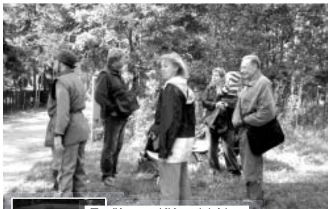
Tančím pro Klánovický les