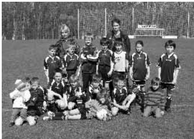
Tým Mini 8A se takhle nechal zvěčnit před zápasem v Újezdě nad Lesy.

mělo velmi emotivní atmosféru. Klánovickým hráčům se podařilo snížit ke konci na přijatelných 1:2 (Filoun). Následující zápas proti mužstvu Háje B byl pro domácí Klánovice opět trápením. Bez patřičného důrazu a s chybami v obraně se nedá vyhrávat, podlehlí jsme 1:3 (Škvor). Na hřišti AFK Unionu Žižkov klánovičtí fotbalisté ukončili černou sérii, když zvítězili 4:1 (Král, Rousek, Dlabal, Borovský).