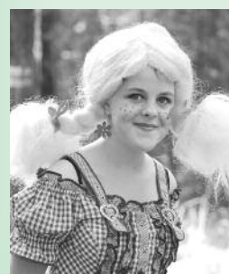
„Maskot dosavadních pěti ročníků“