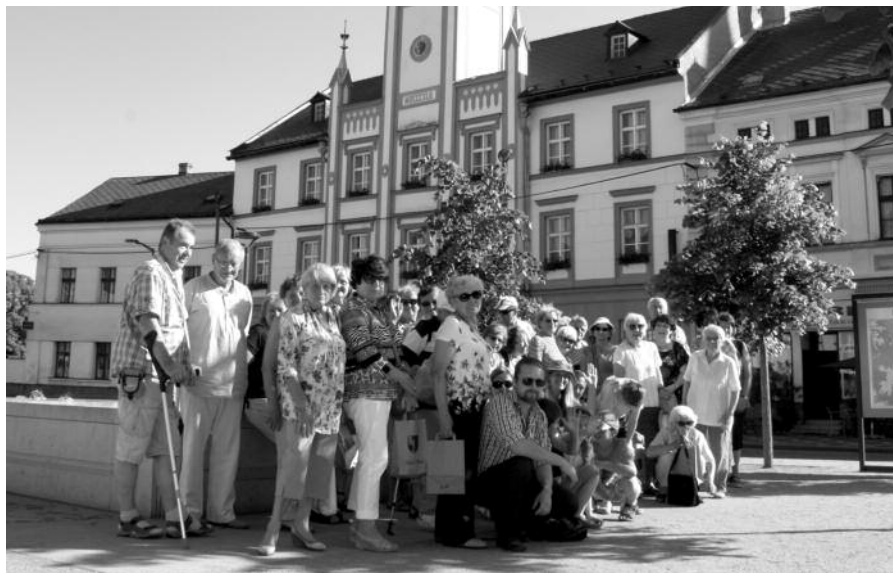
Účastníci zájezdu na náměstí ve Mšeně.