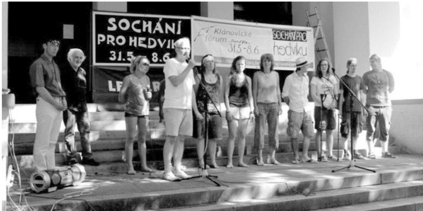
Slavnostní zahájení.

III. ročník sochařského sympozia Sochání pro Hedviku se stal minulostí. Na náměstí Hedviky Vilgusové po něm zůstalo sedm děl.