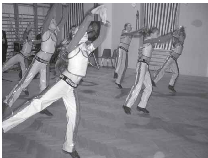
Z vystoupení souboru Silueta