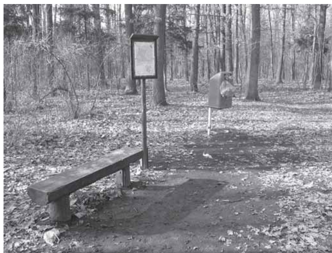
Přeplněný odpadkový koš na naučné stezce Klánovickým lesem