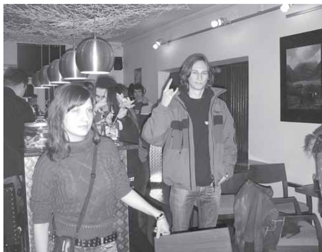
Návštěvník koncertu 1. února zdraví našeho fotografa