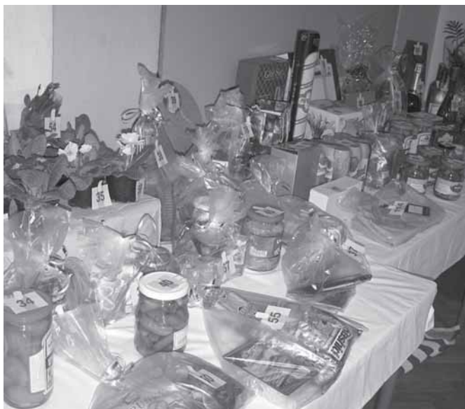
Ukázka cen v tombole

Jedním z prvků, na nichž stojí koncepce naší školy, je pořádání tradičních společenských akcí a slavností, kde se lidé (děti, jejich rodiče a další přátelé školy) mohou příjemným způsobem setkávat. Mezi tyto akce už několik let patří také společenský večer čili ples. Od našich ostatních akcí se pochopitelně liší zaměřením především na dospělé účastníky.