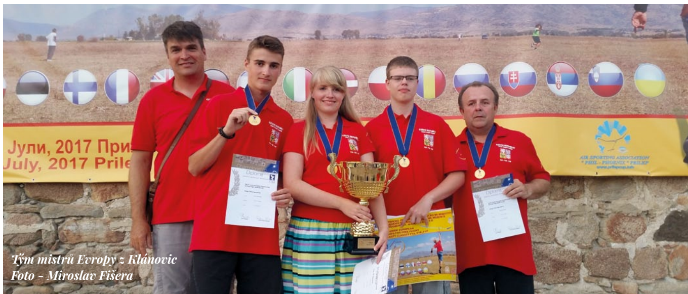
Tým mistrů Evropy z Klánovic