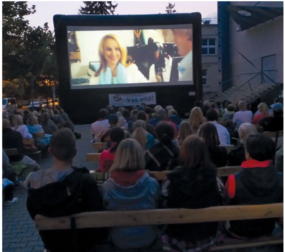
Počasi bylo příznivé a zájem diváků potěšující

Čtyři srpnové večery, od 21.–24. srpna, bylo u klánovické školy opět letní kino. Kinobus Dopravního podniku, který si přes velké množství zájmu jiných městských částí vybral opět za jednu ze svých zastávek po Praze Klánovice, přivezl i tentokrát pestrou a dobrou filmovou nabídku.