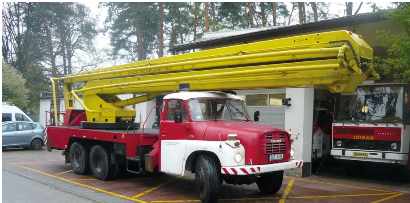
Požární plošina už začala sloužit klánovickým občanům

Nejprve bych chtěl poděkovat všem občanům a firmám, kteří přispěli, a pomohli tak k získání nové techniky Sboru dobrovolných hasičů Klánovice.