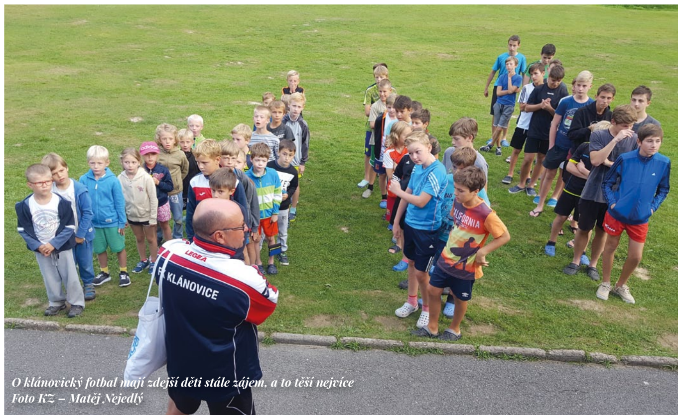
O klánovický fotbal mají zdejší děti stále zájem, a to těší nejvíce